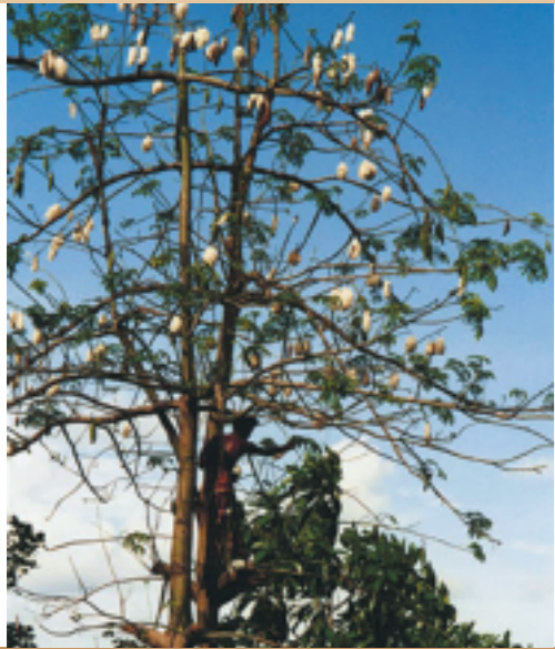
Ernte der Kapok-Kapseln